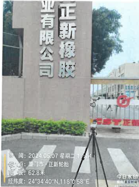
厂界西北侧 1# 24°34'40"N 118°0'58"E