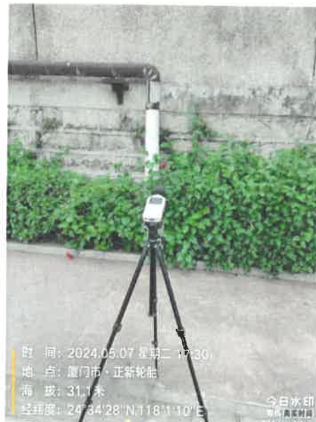
厂界南侧 4# 24°34'28"N 118°1'10"E