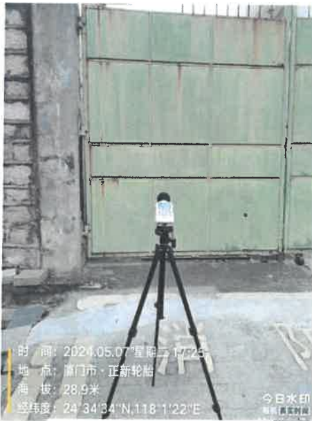
厂界东侧 3# 24°34'34"N 118°1'22"E