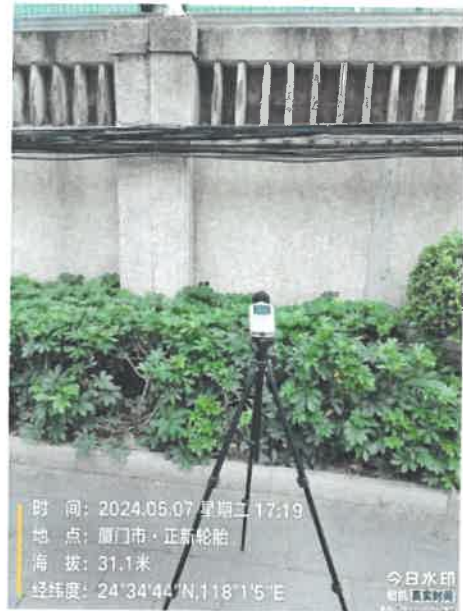
厂界北侧 2# 24°34'44"N 118°1'5"E